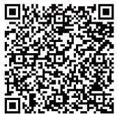
墨田区メッセージはコチラから

65歳以上の高齢者61,034名のうち、1回目の接種終了約52.4%、2回目の接種終了約10.6%(6月5日現在)。心温まる墨田区のメッセージは右記のQRコードからご覧いただけます。