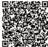
ワクチン接種実施計画はコチラから

5月26日に「武蔵野市ワクチン接種実施計画」(第2版)が公表される始末です。いまだに、第1版は所在不明です。