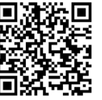
内閣府防災情報「みんなで減災」

11月12日(土)、吉祥寺東部防災会管外視察として、内閣府地区防災計画モデル地区に選ばれた「国分寺市高木町自治会」様をお訪ねしました。